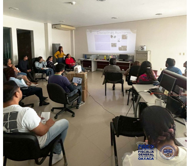
Fotografía 2. Capacitación interna