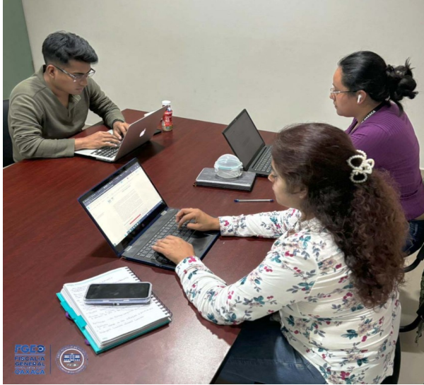
Fotografía 5. Elaboración del Acuerdo de Creación.