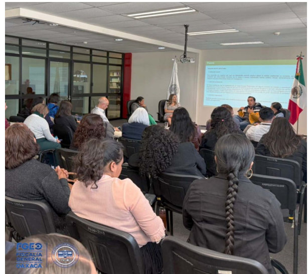
Fotografía 4. Conversatorio Nacional en análisis y contexto para la investigación penal del delito de feminicidio