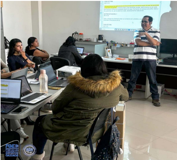
Fotografía 3. Capacitación con consultoría externa