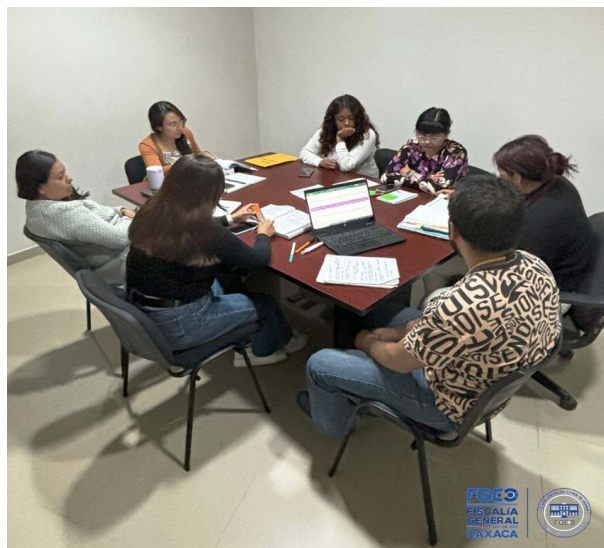
Fotografía 11. Reunión multidisciplinaria para la revisión de carpetas de investigación