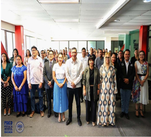
Fotografía 1. Presentación de la Unidad de Análisis y Contexto