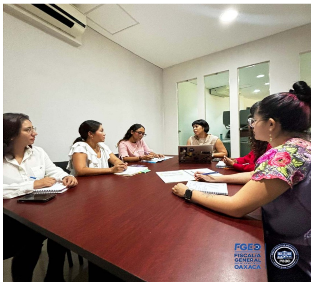
Fotografía 9. Reunión con la Fiscalía Especializada en Atención a Delitos contra la Mujer por Razón de Género