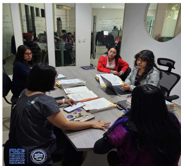
Fotografía 12. Reunión con el equipo multidisciplinario para la elaboración de informes