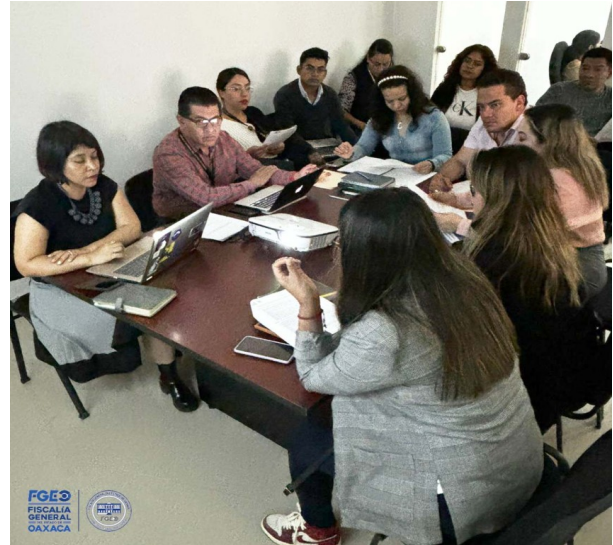
Fotografía 6. Reunión con las y los Titulares de la FGEO