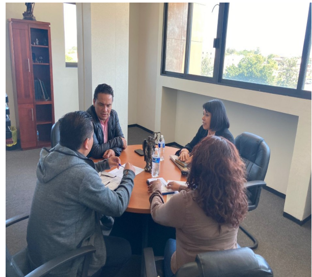
Fotografía 8. Reunión con el Director de Asuntos Jurídicos de la FGEO